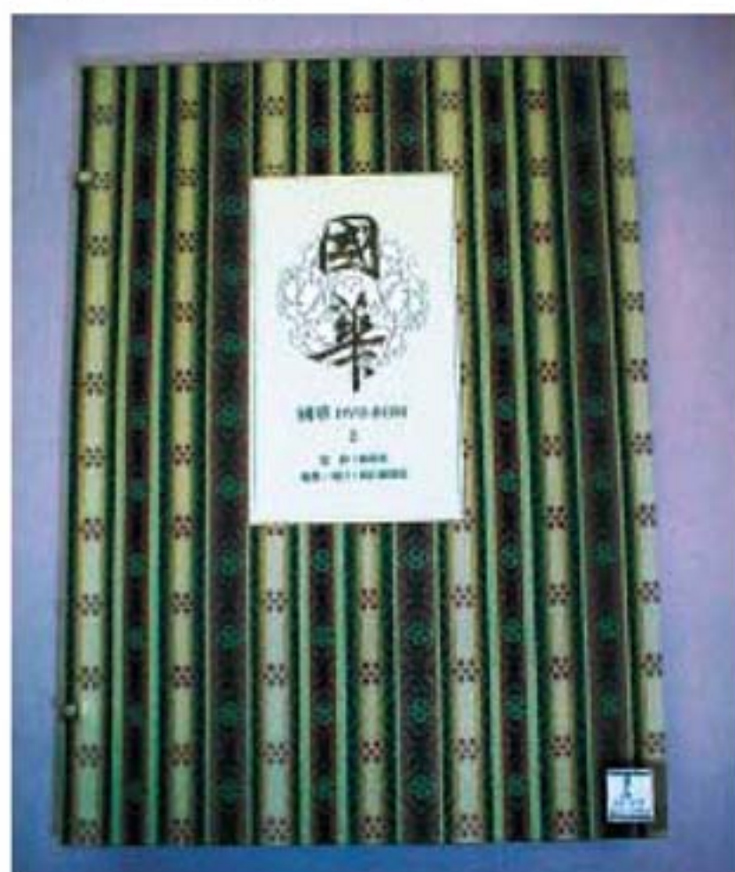
『國華』DVD-ROM 1-2 創刊号(1889年)~1274号(2001年) <本館所蔵>

れている。「美術ハ国民ノ美術ナリ国華ハ国民ヲシテ自国ノ美術ヲ守護スルノ必要ヲ唱導シテ止マサラントス」との文面からもその使命感と啓蒙的姿勢は明らかである。また、そのためには「歴史畫」というジャンルが重要であることも強調されている。つづいて九鬼隆一「国華の発兌ニ就テ」フェノロサ「浮世繪史考」ピゲロー「日本工藝家の注意」岡倉覚三「円山応挙」といった論考を掲載している。「國華」には「歴史教科書」にも必ず登場する美術に関わる人物の名がきら星のごとく並んでいる。ウイーン万博(明治六年)に発するジャポニスムの影響下、西洋のまなざしが浮世絵や工芸品に注目し、「日本美術」のイメージを作り出す一方で、「日本」が主体となって多くの貴重な古美術品の流出を防ぎ、世界に認められる「日本」の「美術」を守り、「美術史」を形成しなければならぬという事情が『國華』の創刊を促したといえよう。